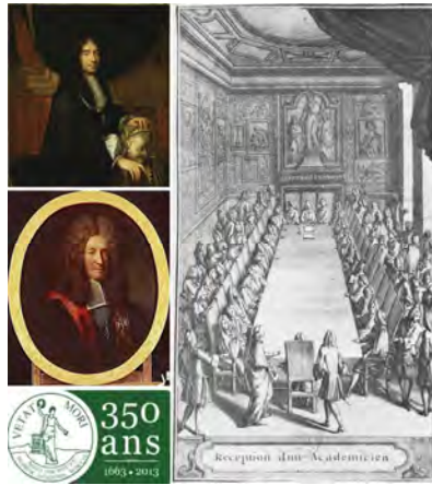
A g., en haut : portrait de Charles Perrault ; en bas : Louis de Pontchartrain ; à dr. : gravure de F. Delamonce d'après N. de Poilly, Réception d'un Académicien .

Retrouvez la Lettre d'information de l'AIBL sur son site internet : www.aibl.fr . Téléchargeable au format pdf, à partir de son n° 42, sa consultation est facilitée grâce à une table des matières intégrée.